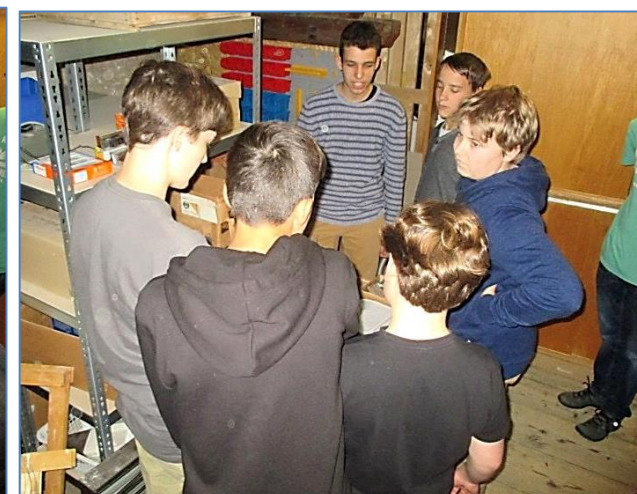
Und die Jugendmitglieder beraten das Präsentationsmodul Bauma